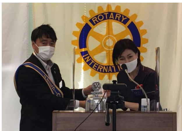
開店のお祝いをクラブよりお渡し致しました。