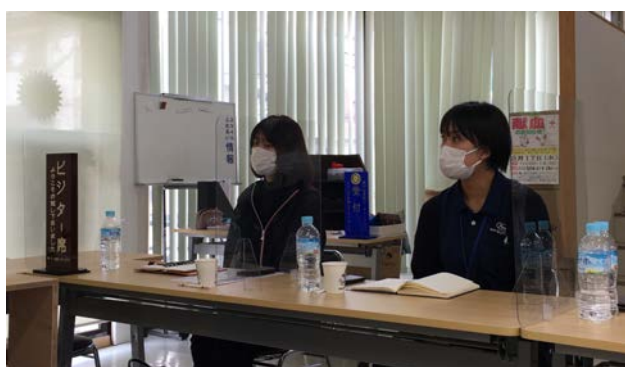
RYLA 研修生のお二人にお越しいただきました。